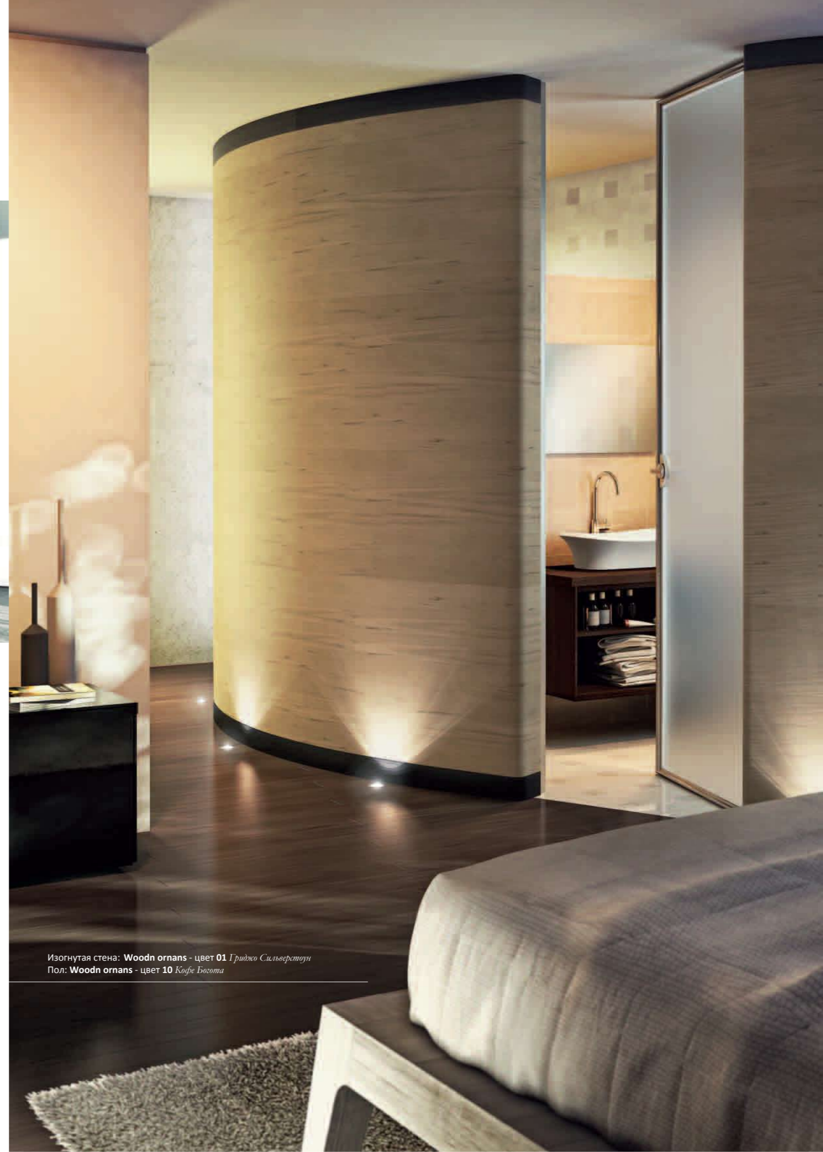
Изогнутая стена: Woodn ornans - цвет 01 Гриджо Сильверстоун Пол: Woodn ornans - цвет 10 Кофе Босота

Для полной проектной и композиционной свободы цвета и формы можно варьировать , используя по желанию обе стороны – гладкую и рифленую . Богатый комплект аксессуаров – профили для плинтуса, бордюры, внутренние и внешние уголки – дополняют коллекцию, делая гибкость в использовании ее главной характерной чертой.