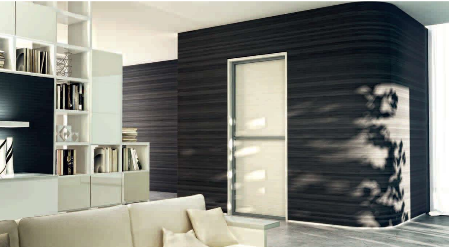
Стена: Woodn ornans - цвет 14 Гриджо Сильверстоун

Woodn ornans выпускается планками в 100 или 33 мм, обладает свойством термоформуемости , в том числе под острым углом , может применяться для облицовки самых сложных поверхностей, таким образом, буквально выходя за пределы возможностей материала.