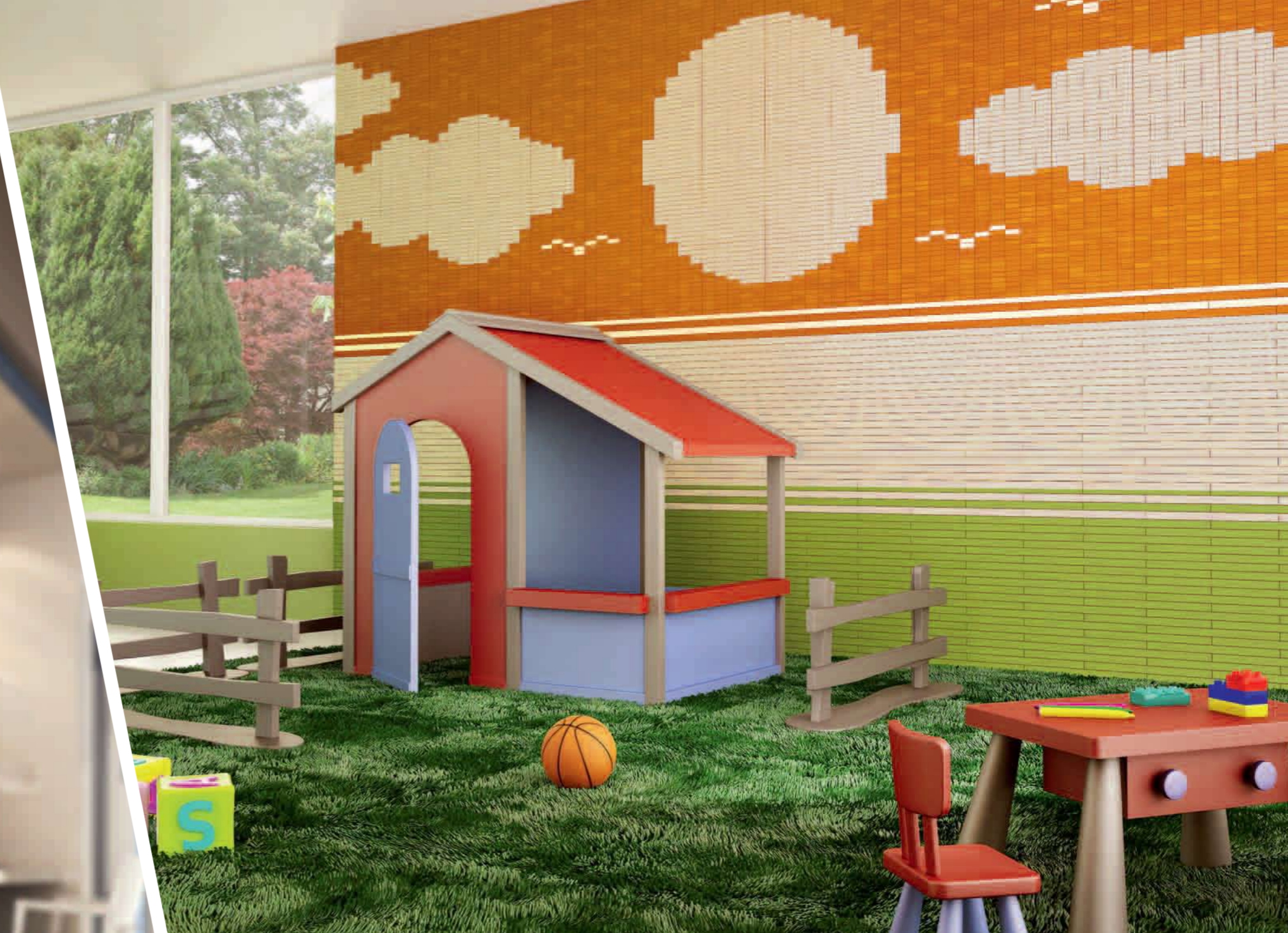
стены - изготовлены по запросу: Woodn ornans compositus цвет: 23 Аранчо Сицилиано, 22 Верде Тоскано и 01 Бьянко Каррара

Композитный материал Woodn ornans – это многогранность: цвет, элегантность и оригинальность обеспечивают максимальную свободу выражения, эстетической интерпретации и вкуса.