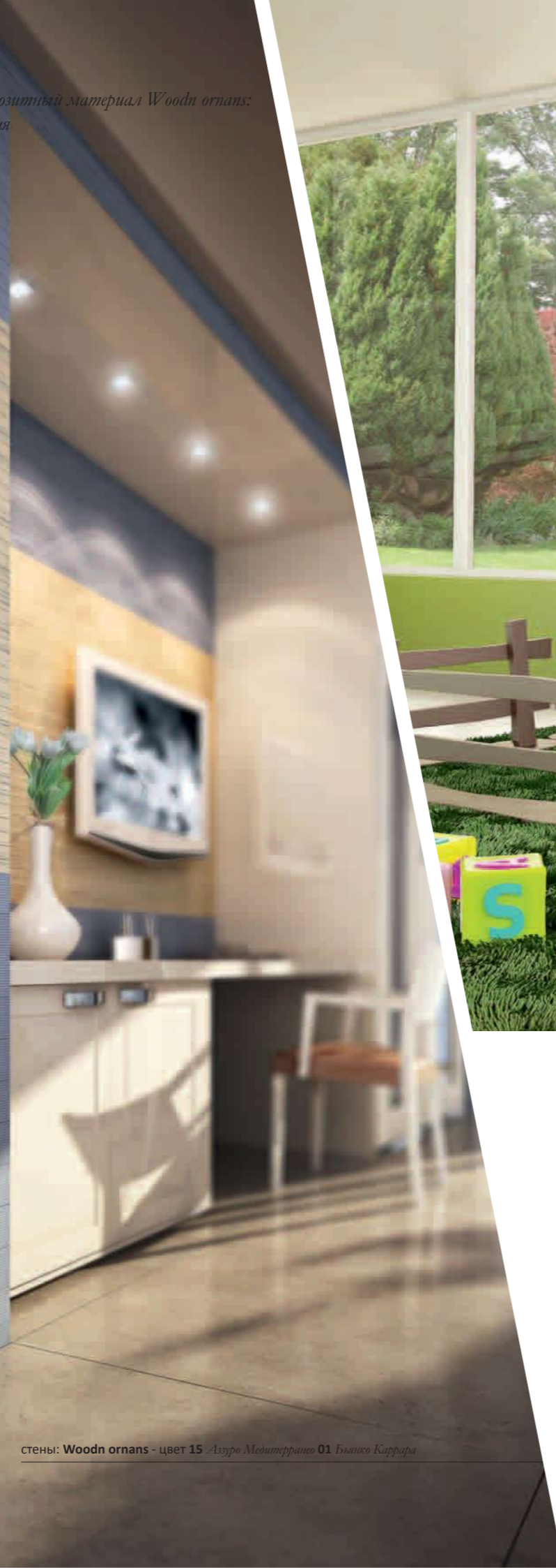
стены: Woodn ornans - цвет 15 Азура Медитерранео 01 Бьянко Каррара